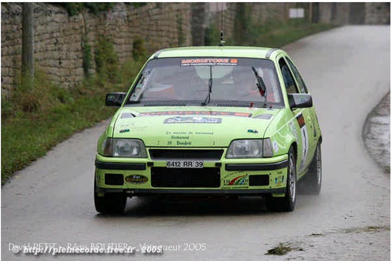
David PETIT - Régis BOUTIER - Vainqueur 2005 http://ptelecoms.com.free.fr - 2005